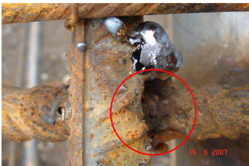
Obr. 6 - Zápal u nenosného svaru do hloubky 5 mm, přípustné 1 mm