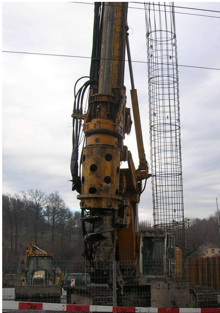
Obr.3 – Ukázka manipulace se svařenou výztuží pilot nad hlavami dělníků

Technické podmínky rozlišují a konkrétně jmenují, jaké jsou nosné a nenosné spoje betonářské oceli. Nosný spoj plně nahrazuje základní materiál oceli. Mezi nosné spoje však také patří spoje, které jsou prováděny na betonářské oceli osazené mimo bednění v případě, že je třeba tyče svařit do prostorové prutové konstrukce a potom se následně s touto konstrukcí manipuluje zdvihacími prostředky, nad hlavami dělníků nebo občanů v rámci výstavby v zastavěném území, viz Obr.3. V každém případě však musí být nosné a nenosné svary viditelně vyznačeny ve výkresové dokumentaci realizační dokumentace stavby (RDS). Nepostačuje pouze obecná věta, že se provádějí tupé nosné svary nebo křížové svary v prostupech ocelových desek. Všechny svary musí být označeny jako nosné svary - NS nebo jako nenosné svary – NNS. Svářečský dozor je povinen provádět kontrolu svařování betonářské oceli podle jmenovitých konkrétních údajů ve výkresech. Není oprávněn určovat, jaký svar je nosný nebo nenosný. Je plně zodpovědný za kontrolu shody mezi výkresem a realizací. Pokud jsou svary označeny rozporuplně, obecně nebo nejsou označeny vůbec, zhotovitel stavby je povinen požádat o jejich doplnění autora RDS a to do výkresové dokumentace, nikoliv pouze slovně do stavebního deníku. Stavební dozor objednatele je potom povinen provádět kontrolu výkonu svářečského dozoru zhotovitele.