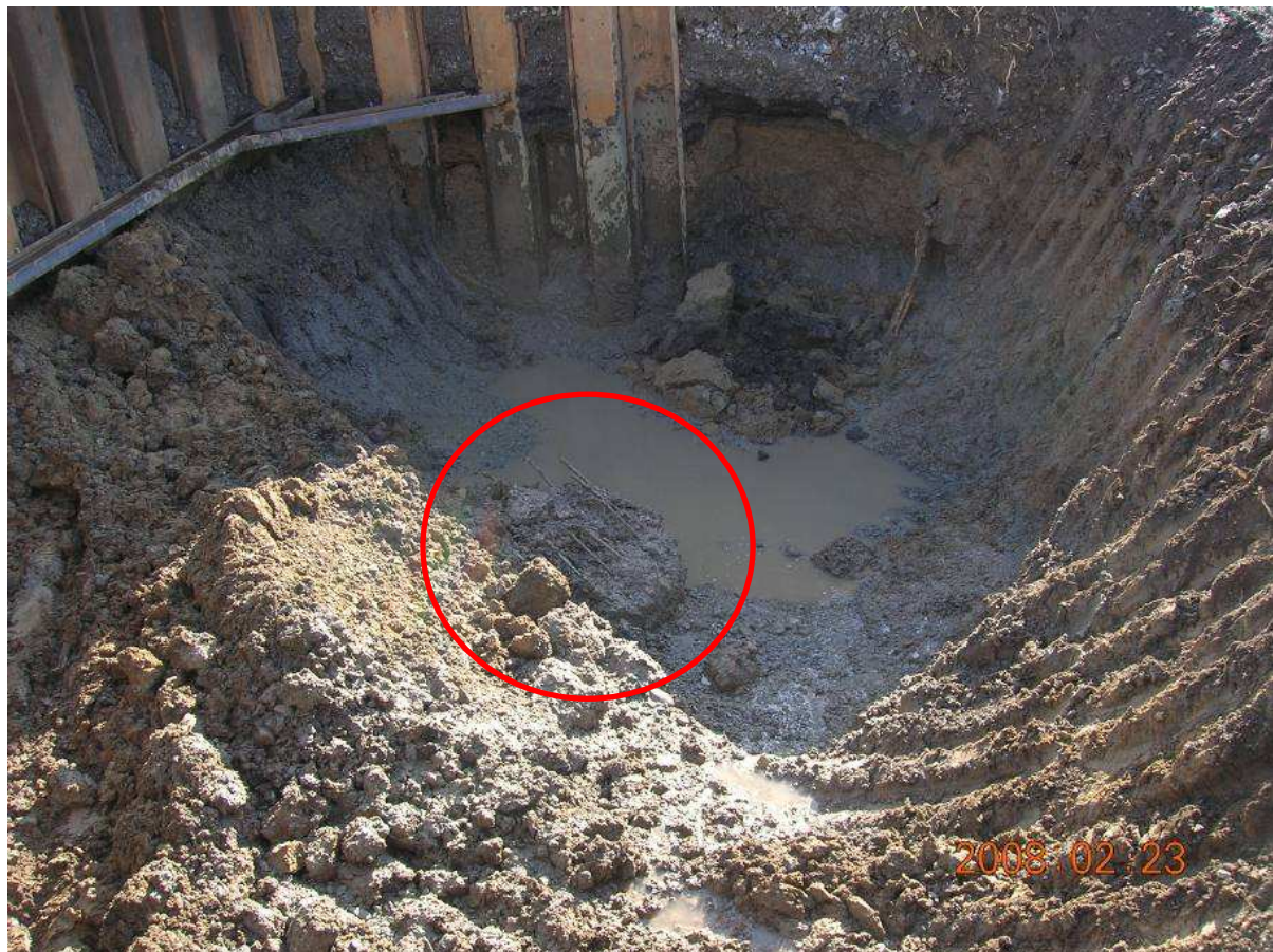
Obr.4 – Zdeformovaná výztuž pilot spodní stavby opěr mostu

Technické podmínky obsahují údaje o přídavném materiálu ke svařování, způsob svařování, kladení jednotlivých svarových housenek, parametry svařování, tvary úkosů tupých, přeplátovaných, křížových spojů atd. Konkrétně specifikují, jaký je obsah formuláře WPQR (kvalifikace postupu svařování), kde se dokladuje jednak pracovní diagram svaru, ale i základního materiálu. Průkazní zkouškou se musí vyloučit poškození materiálu (degradace) vlivem zkrěhnutí oceli, v teplem ovlivněné oblasti svarového spoje.