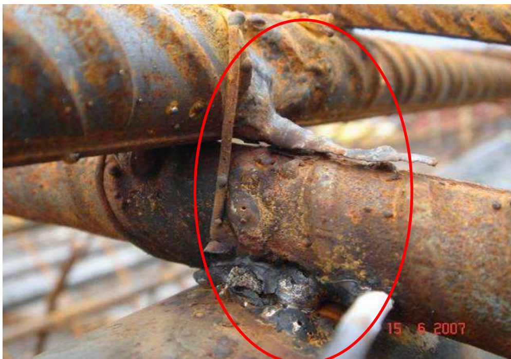
Obr.5 – Studený spoj nenosného svaru

Současně s tabulkovým přehledem nejčastějších vad svarů jsou uvedeny konkrétní příklady vad svarů, ukázka je na Obr.5 a na Obr.6